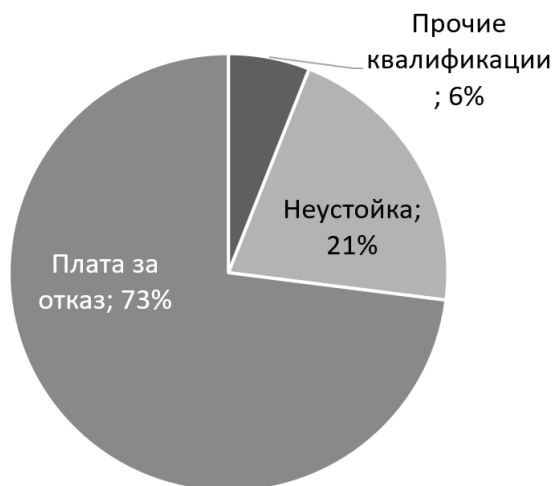
Рис. 1. Соотношение квалификаций

Как видно, доминирует верная квалификация по п. 3 ст. 310 ГК, однако в 27 % (т. е. почти в трети) от общего числа отобранных судебных актов положение договора, предусматривающее условие о плате за отказ, было квалифицировано как-то иначе. На втором месте по популярности – неустойка. Зачастую суды не видят особой разницы между платой за отказ и неустойкой, нередки случаи, когда суд округа оставляет в силе акты нижестоящих судов, указывая, что ошибочная квалификация платы за отказ в качестве неустойки не привела к принятию неправильного решения.